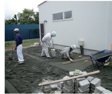
敷砂転圧・高さ調整