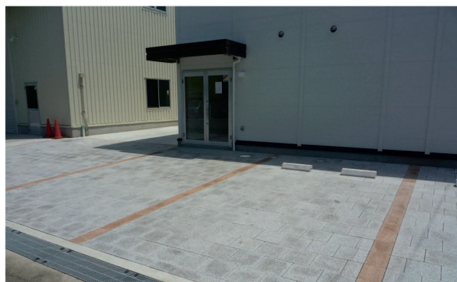
和歌山市内駐車場