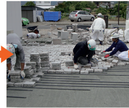
ガイドレール敷設